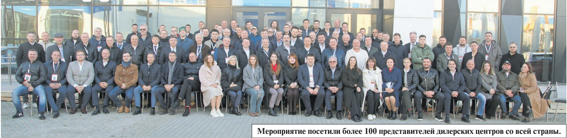
Мероприятие посетили более 100 представителей дилерских центров со всей страны.