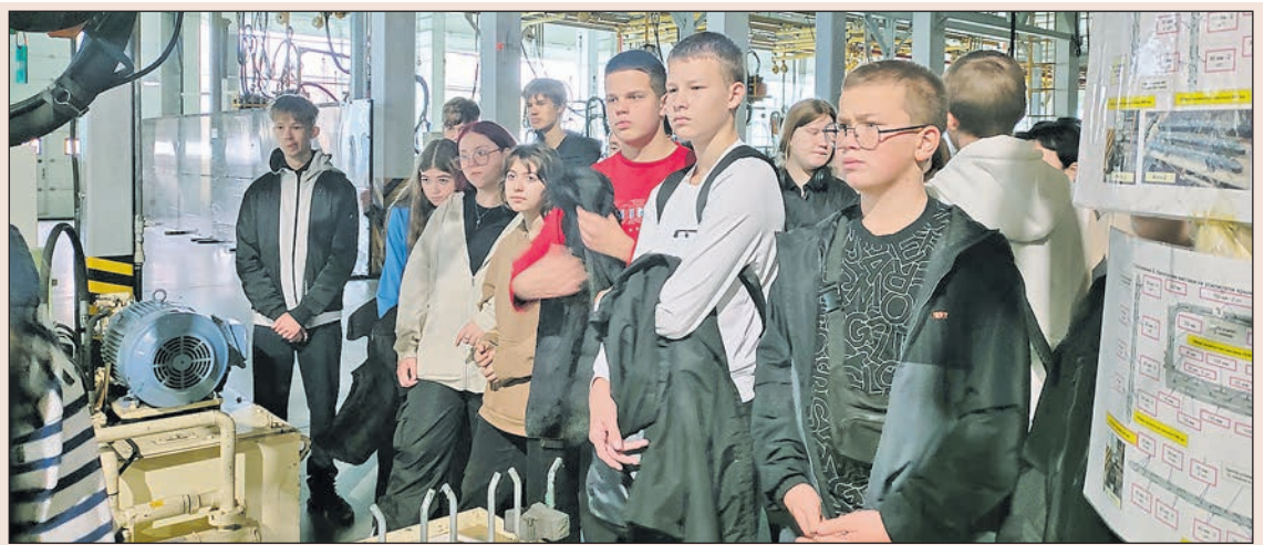
Ученики восьмого класса школы № 6 познакомились с работой завода АВТОТОР. Экскурсия на предприятие состоялась в рамках проекта «Движение Первых» по профессиональной ориентации «Первые в профессии».