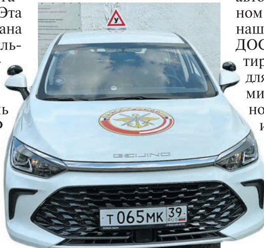
Учебно-экзаменационный BAIC U5 PLUS оснащен газобаллонным оборудованием, производство которого уже локализовано.

Автомобиль оснащен газобаллонным оборудованием, производство которого локализовано компанией «Газпром газомоторные системы» на территории Московской области. В