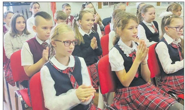
Рассказ получился настолько увлекательным и драматичным, что его, затаив дыхание, слушали не только дети, но и взрослые.

- Проект «Правильные тетрадки» нацелен на сохранение исторической памяти о наших национальных героях. На тетрадках изображены такие выдающиеся личности, как Марина Раскова, красноармеец Александр Матросов, медсестра Гуля Королева,