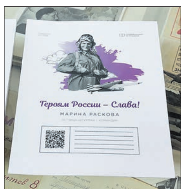
Урок прошел в рамках проектов «Правильные тетрадки» и «Имена Героев на карте Калининграда».