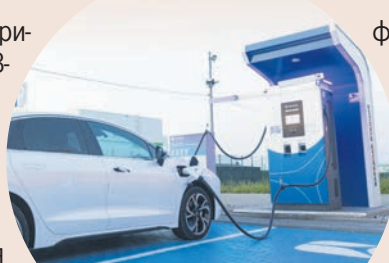
На базе электрического седана АМБЕРАВТО А5 уже сформирован парк сервиса электротакси, который пользуется большой популярностью.

- Есть два ключевых направления развития. Первое - создание инфраструктуры. Здесь не встает вопрос, что первично. Очевидно, что если будет ин-