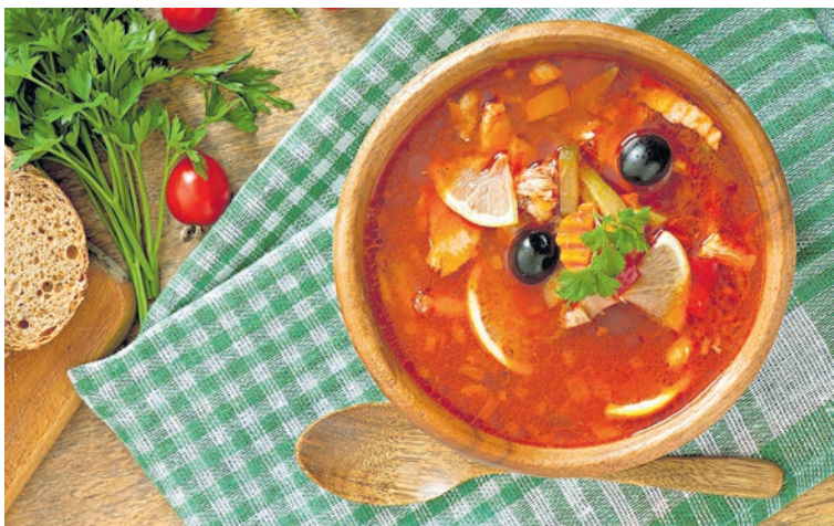
Правильно приготовленное первое - это довольно сбалансированное блюдо с содержанием важных микроэлементов.