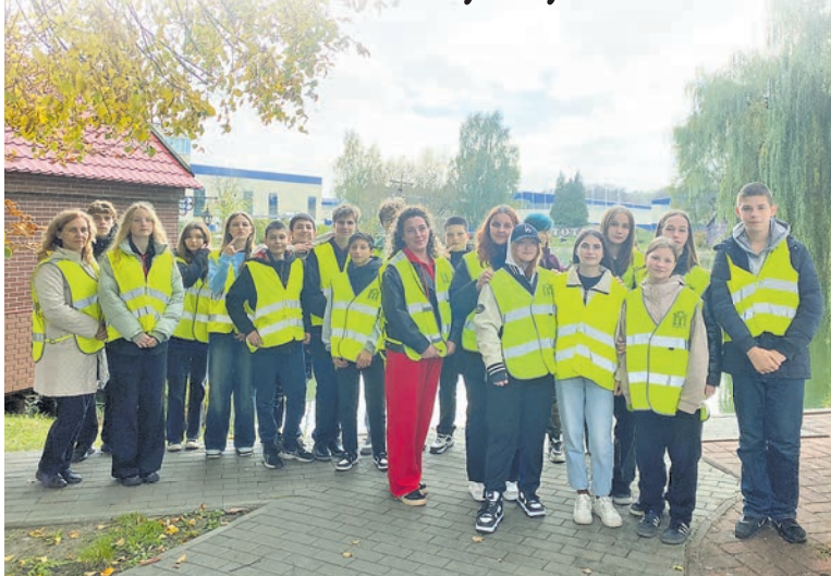
Ребята из различных учебных заведений Калининграда и области познакомились с работой нашего предприятия.

Так называется проект, направленный на профессиональную ориентацию школьников 6-11-х классов. В рамках проекта ребята из различных учебных заведений Калининграда и области познакомились с работой завода АВТОТОР, историей предприятия, а также мерами социальной поддержки при трудоустройстве.